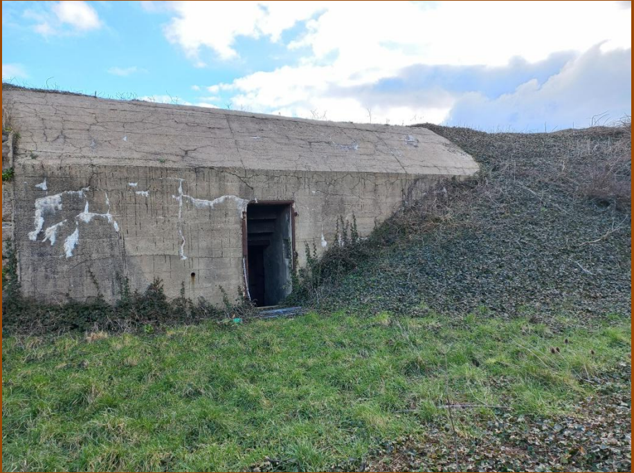
Pendant ce temps, les petites mains d'Orchis travaillent aux abords du gros blockhaus un peu plus loin, de part et d'autre de la grille.