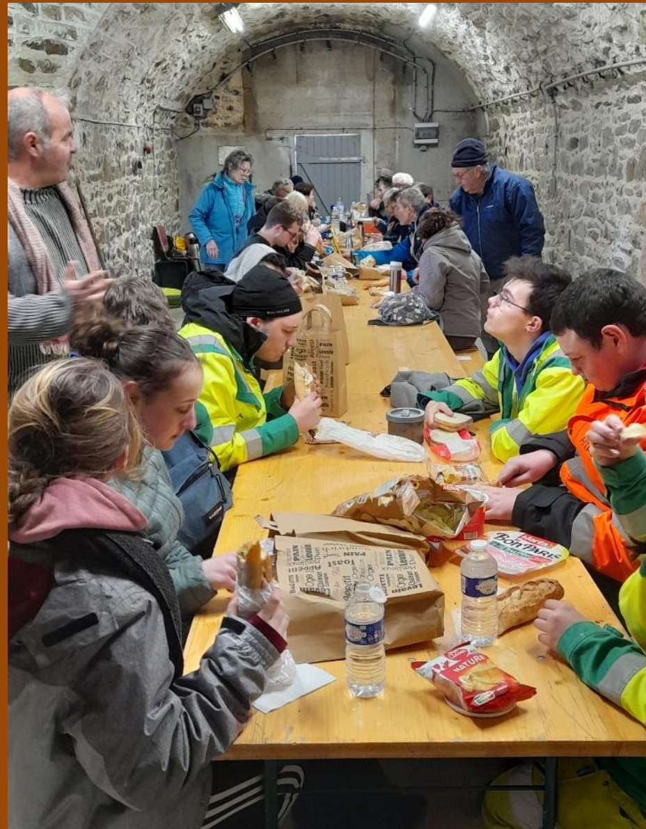
12h 15 – 13h : Pique-nique dans la salle sous la tour de la Hougue.