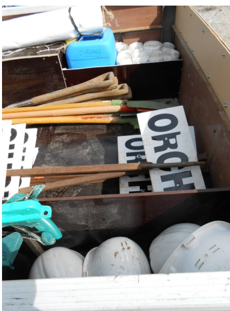
Vue de l'avant droit, de haut en bas et de gauche à droite : la banderole, un bidon de 20l d'eau, les éléments de banderole, les pelles, les flèches, les casques...