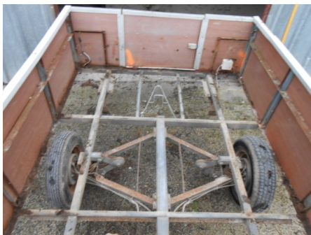
Après désossement et avant les travaux.