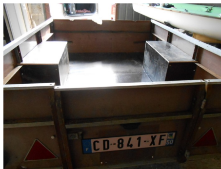
La structure est en place, la plaque d'immatriculation est amovible, selon le véhicule tracteur