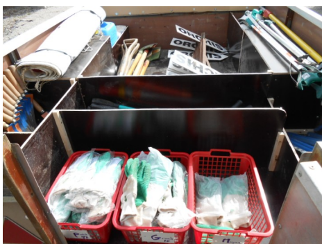
Vue de l'arrière porte ouverte : banderole, pelles, pinces à déchets, faucilles, coupe-branches, scies, gants

Tout le matériel est dans la remorque. Les deux caisses pédagogiques peuvent prendre place en remplacement des flèches et pelles. Des tables et chaises peuvent être mises au dessus dans cette partie. Reste le problème de la couverture : le couvercle est lourd et n'est pas maniable par une seule personne. Une solution pourrait être une bâche. Pour continuer dans le simple, ce pourrait être de la toile cirée coupée/cousue aux dimensions adéquates. Après le figelage : on peint de quelle couleur ...?